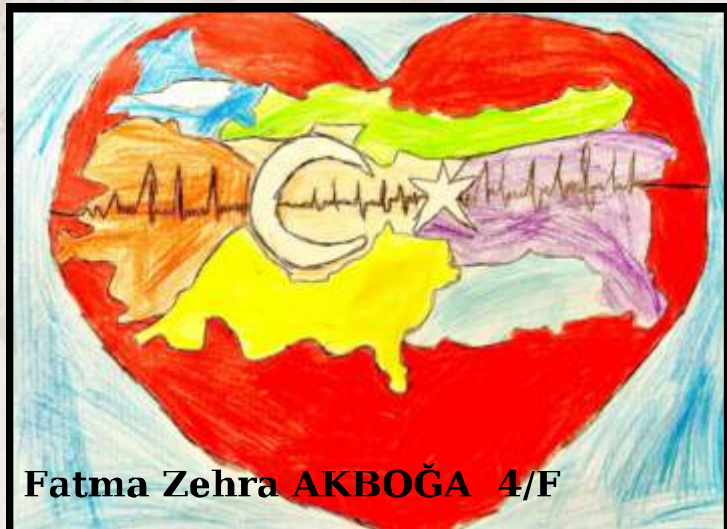
Fatma Zehra AKBOĞA 4/F