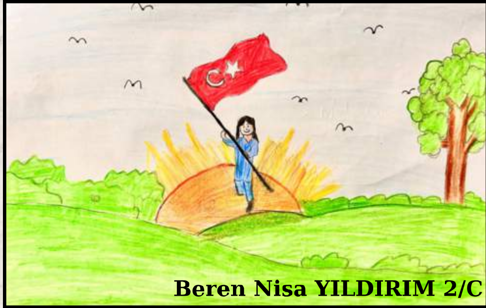
Beren Nisa YILDIRIM 2/C