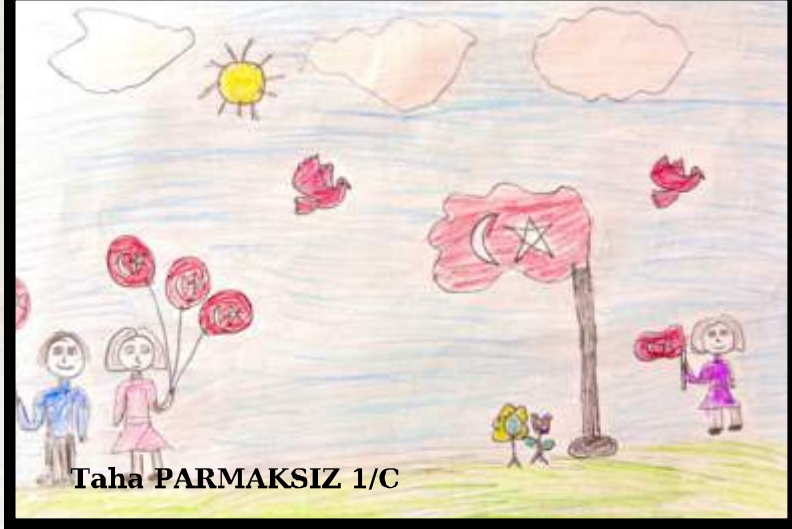
Taha PARMAKSIZ 1/C